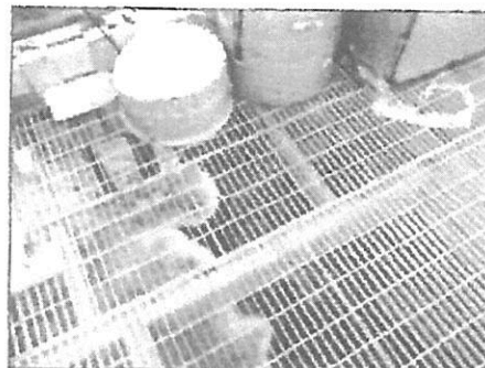
Fotografía 2: Punto de Muestreo