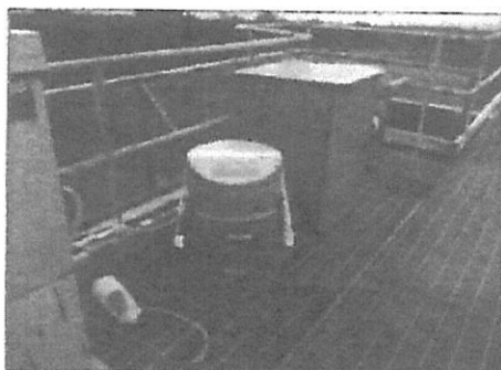
Fotografía 1: Instalación Equipo Automático